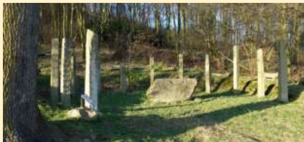
Letzte Station des Kreuzweges

Der Steyregger Kreuzweg wurde mit Unterstützung von Sponsoren aus dem kulturellen Bereich, Industrie, Vereinen und Privatpersonen realisiert.