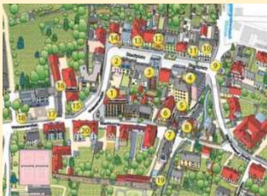
Stationen des Stadtwanderweges

Der Steyregger Kreuzweg wurde mit Unterstützung von Sponsoren aus dem kulturellen Bereich, Industrie, Vereinen und Privatpersonen realisiert.