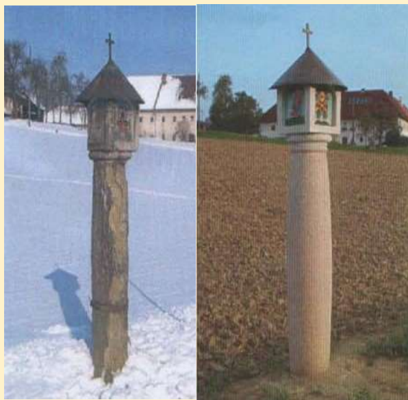
Bildstock Götzelsdorf vor und nach der Restaurierung

Der Verein ist auch aktiv an der Restaurierung von Kleindenkmälern beteiligt, um diese für die Zukunft zu erhalten. Wenn eine Erhaltung nicht möglich ist, beteiligen wir uns an der Gestaltung einer Neuerrichtung.