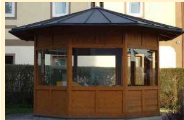
Pavillon des Stadtmodells am Stadtplatz

Der historische Stadtwanderweg führt interessierte Besucher durch die historische Stadt Steyregg. Auch Führungen durch den Nachtwächter sind möglich.