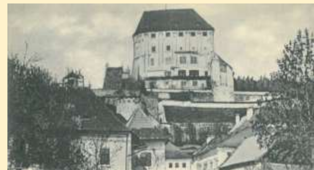
Steyregger Schloß um 1900

Wir kündigen diese Veranstaltungen auf unserer Homepage, mit Plakataushängen in Steyregg und mit einem Email-Newsletter an.